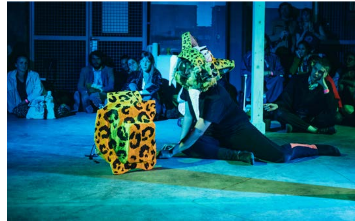
Ci-contre Tremendo Parche Latino (cd Valentine Zeller)