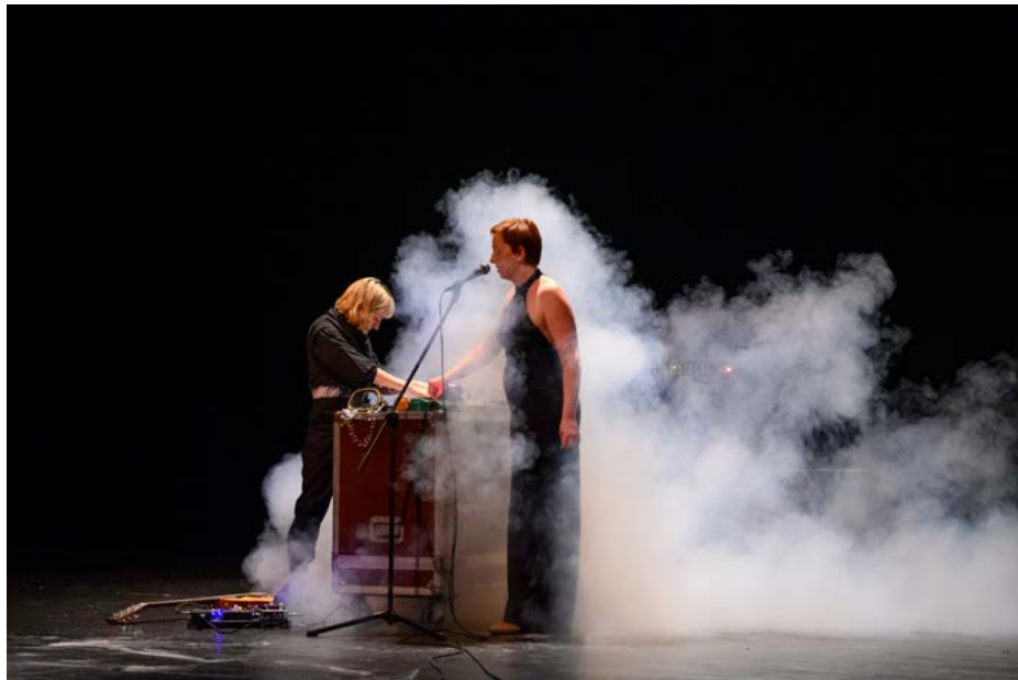
AMAS Positive feedback loop