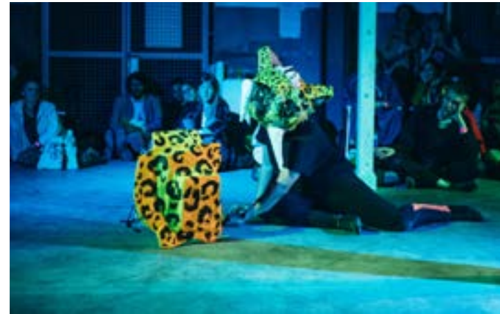
Ci-contre Tremendo Parche Latino (cd Valentine Zeller)